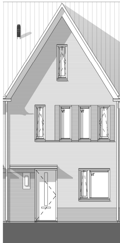
VOORGEVEL 1 : 100