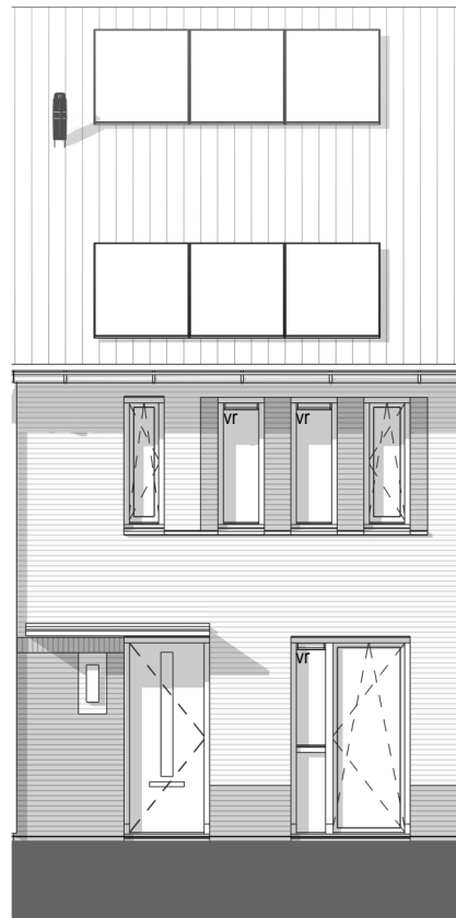
VOORGEVEL 1 : 100